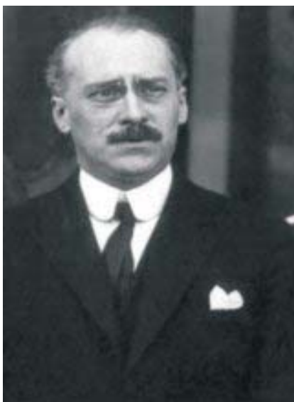
și la apogeul carierei