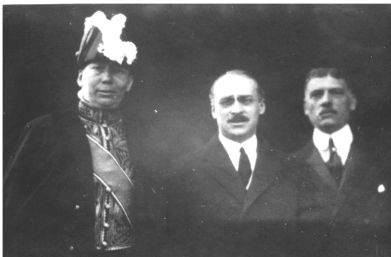
La Londra, în 1924, alături de Nicolae Titulescu, cu ocazia vizitei suveranilor României în Marea Britanie