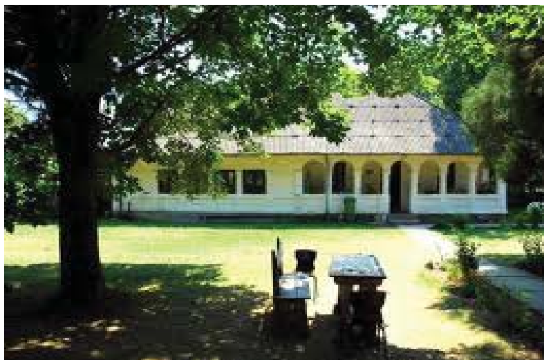
Casa memorială Ion Gheorghe Duca, Măldărești, jud. Vâlcea construită în 1912 drept casă de vacanță, astăzi muzeu