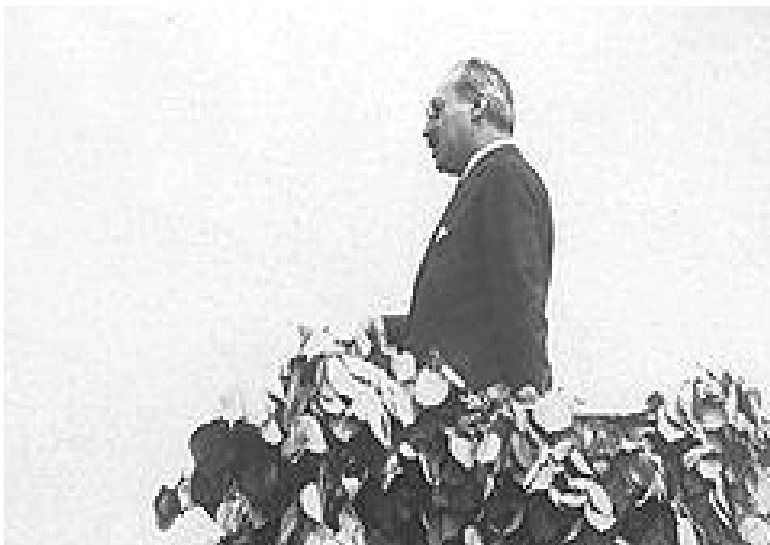
În campanie electorală