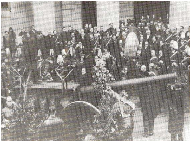
Înmormântarea lui Ion Gheorghe Duca