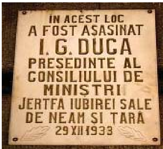
Plăcuța comemorativă amplasată în gara din Sinaia