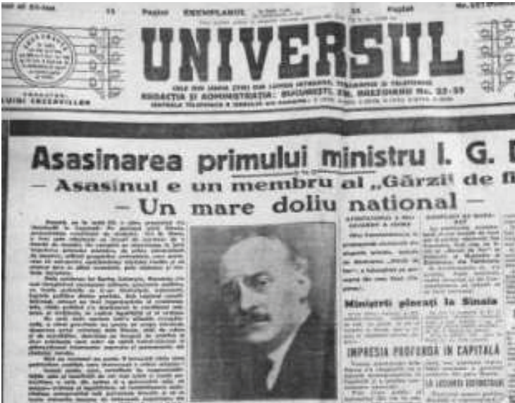
Tragicul eveniment, în cel mai important ziar al timpului