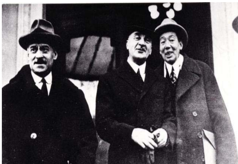
În 1931, împreună cu Iuliu Maniu și Nicolae Titulescu