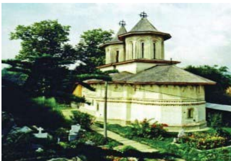
Biserica de la Urșani, apropiere de Horezu, în pronaosul căreia se găsește mormântul lui Ion Gheorghe Duca