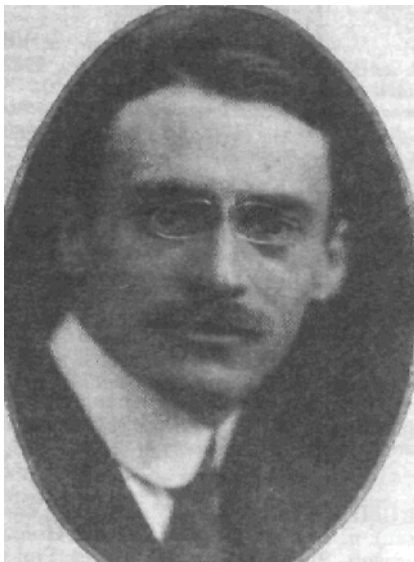
Ion Gheorghe Duca, în tinerețe...