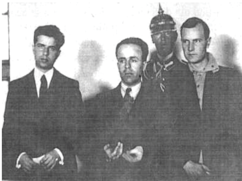
„Nicadorii”, în timpul procesului